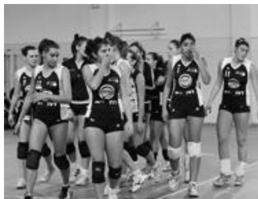
I volti sconsolati delle tavazzanesi alla fine del match